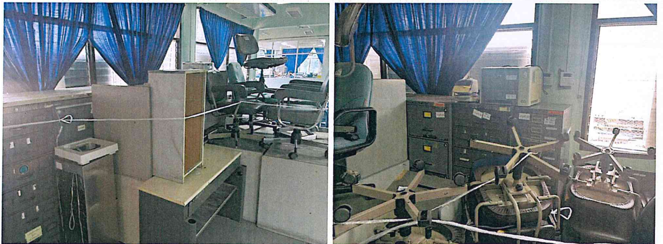
ชั้น ๓ หน้าห้องฝ่ายตรวจสอบ ประกอบด้วย ตู้เหล็ก, เก้าอี้ , โต๊ะไม้ , โต๊ะคอมพิวเตอร์ , เครื่องเคลือบบัตร , เครื่องพิมพ์แบบเลเซอร์ และ เครื่องบันทึกเวลา