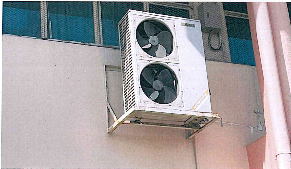
ชั้น ๒ ระเบียงห้องสำนักผู้อำนวยการ ประกอบด้วย คอยน์ร้อน ยังไม่รี้อถอน (ค่ารี้อถอนเป็นผู้ประมุค)