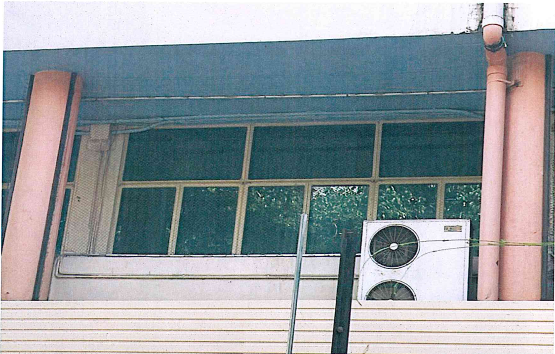
ชั้น ๒ ระเบียงห้อง hands on ประกอบด้วย คอยน์ร้อน ยังไม่รี้อถอน (ค่ารี้อถอนเป็นผู้ประมุค)