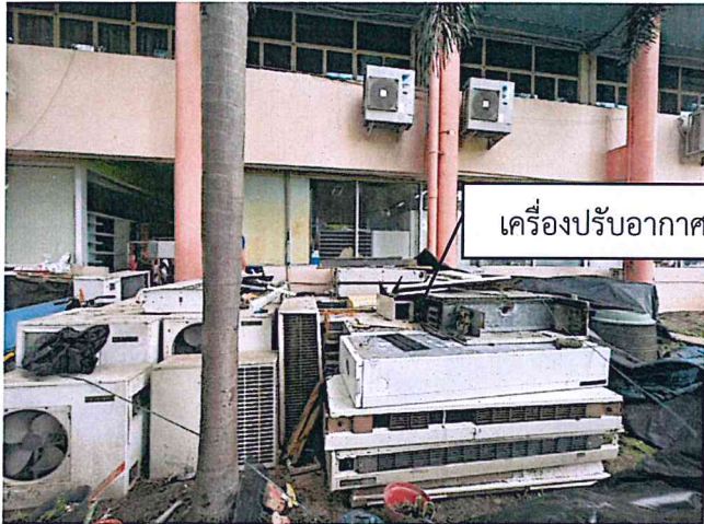
เครื่องปรับอากาศ