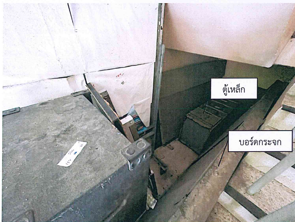
ชั้น ๑ ฝั่งห้อง SSC ประกอบด้วย บอร์ดไม้ , บอร์ดกระຈก , โต๊ะไม้ , เก้าอี้ , ตู้เหล็ก และลำโพง