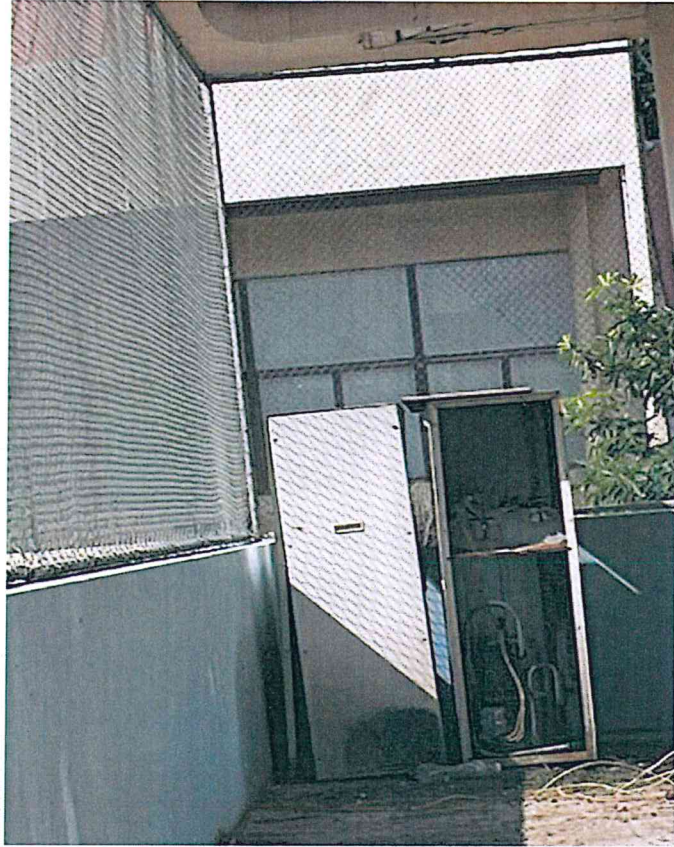
ชั้น ๔ ระเบียงห้องประชุมบัวน้ำเงิน ประกอบด้วย คอยน์ร้อน